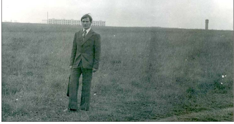
Гатчина. 1979 г. микрорайон Аэродром. В кадре дом ул. Авиатриссы Зверевой, 17 ( быв. адрес Новоселов, 16) Пристал Николай Кузора