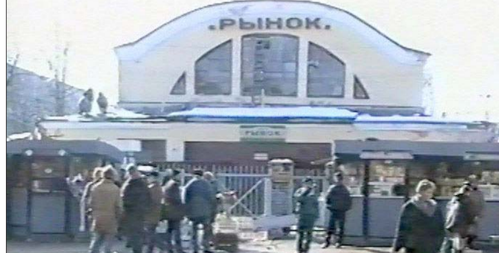
Гатчина. 1995 г. Гатчинский колхозный рынок.