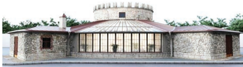
Северо-западный фасад. Вид с ул. Киевская

Если в ближайшее время судьба Круглой риги не будет решена — мы будем наблюдать, как она превратится в груду кирпичей...а через некоторое время эту землю просто выкупят — и здесь будет очередной высотный дом.