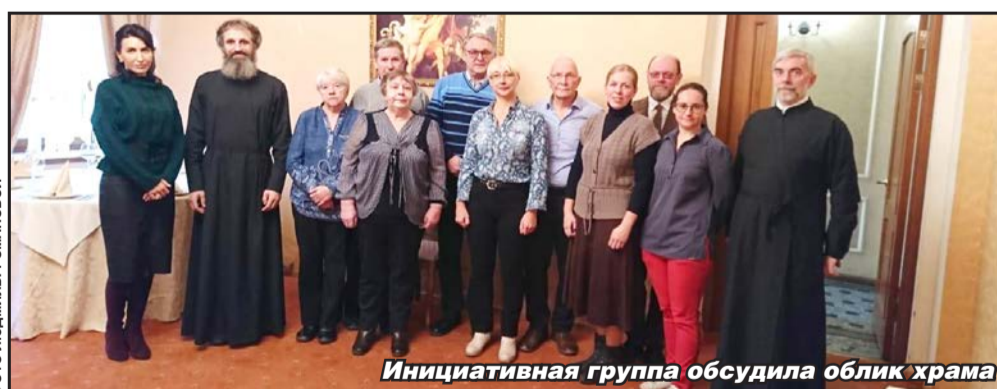
Инициативная группа обсудила облик храма