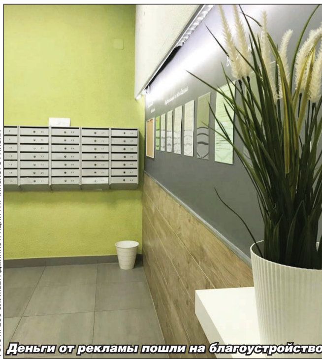
Деньги от рекламы пошли на благоустройство