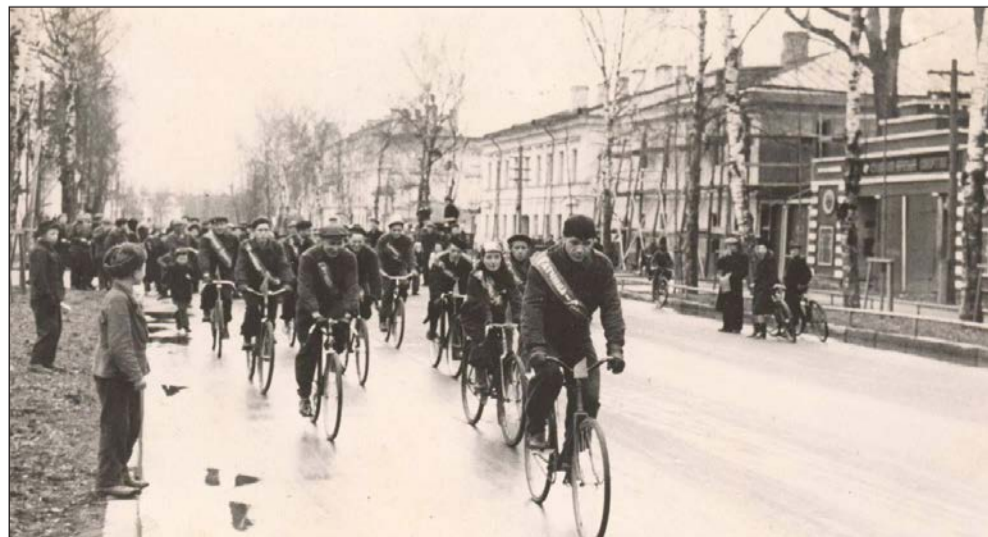
Гатчина. 1950-е гг. Велопробег (Гатчина-Ленинград???) на пр. 25 Октября.