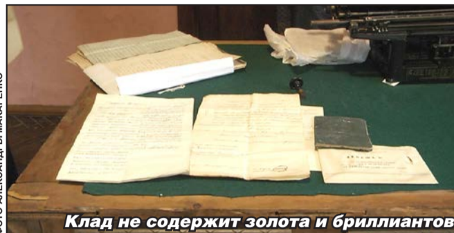
Клад не содержит золота и бриллиантов