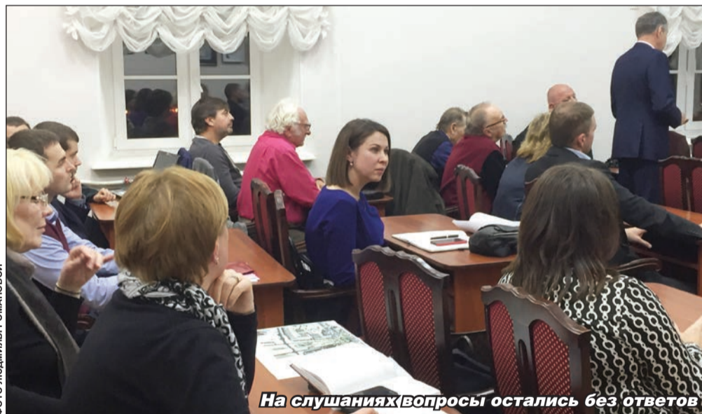
На слушаниях вопросы остались без ответов