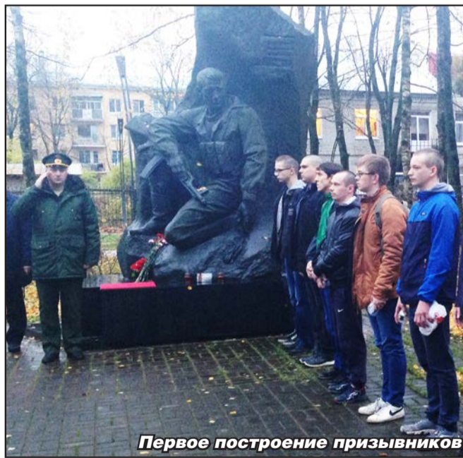
Первое построение призывников