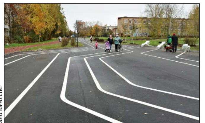
этап планируется реализовать в следующем году — от улицы 7 Армии до улицы Рощинской.

Проект бульвара будет реализован в несколько этапов: в этом году выполняются работы от ул. Константинова до ул. 7 Армии. Специалисты обещают, что строительные работы на первом участке завершатся до конца ноября. Второй