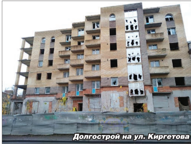
Долгострой на ул. Киргетова

Участники встречи высказали опасение, что со строительством нового многоквартирного дома ухудшится транспортная доступность и увеличится существующая нагрузка на учителей и врачей в микрорайоне Аэродром. По словам представителей профильных комитетов районной администрации, на Аэродроме уже функционирует новая поликлиника, планируется построить две школы и другие социальные объекты. Об этом напомнил