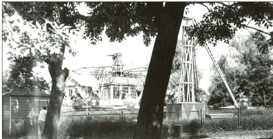
Гатчина. 1975. Городок аттракционов в парке. Фотофиксация гатчинского дворцового парка. Съёмка Б.А. Удальцова по методу проф. Л.М. Тверского. Место хранения — Музей города Гатчины