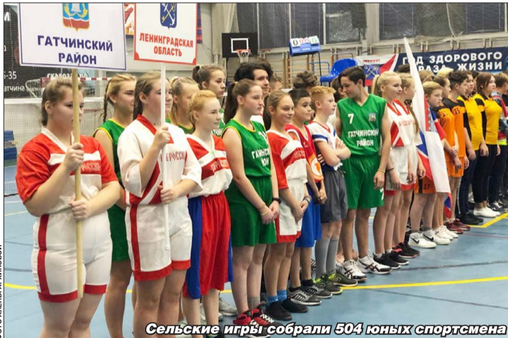
Сельские игры собрали 504 юных спортсмена

Схема ограничения движения на 17 странице.